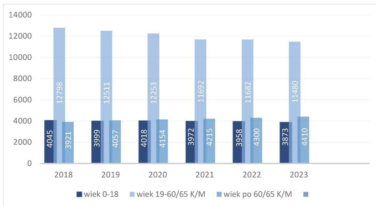
INFOGRAFIKA 2: Struktura ludności Miasta Łaziska Górne na przestrzeni lat 2019-2023, (dane UM w Łaziskach Górnych)

Tendencja spadkowa dotyczy też liczby mieszkańców poniżej 18 roku życia. W 2023 roku było ich 3873 , w 2022 – 3958, w 2021 – 3972, w roku 2020 - 4018, przy 4045 osobach w roku 2019 i 3999 w roku 2018.