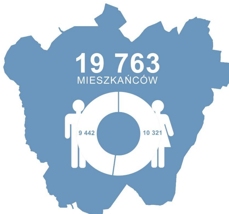
INFOGRAFIKA 1: Liczba mieszkańców Łazisk Górnych wg. stanu na 31.12.2023 (dane UM w Łaziskach Górnych)

w procesie starzenia się społeczeństwa, co wpisuje się w tendencję obserwowaną w powiecie mikołowskim, województwie śląskim i ogólnie tendencja krajową.